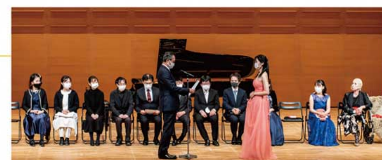
第2回大会授賞式の様子